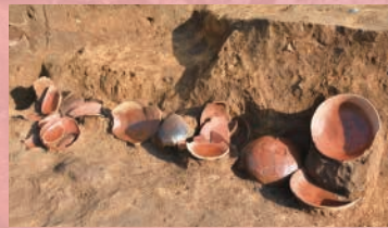
おしましきりざわみなみいせき 小島仕切沢南遺跡