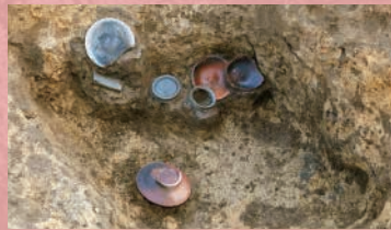
きたほりしんでんいせき 北堀新田遺跡