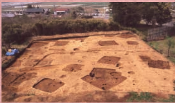
びわばしいせき 枇杷橋遺跡

本庄市は遺跡の宝庫。昨年もたくさんの発掘調査を行いました。 その中から5遺跡をご紹介します。採れたて発掘情報をお届けします！