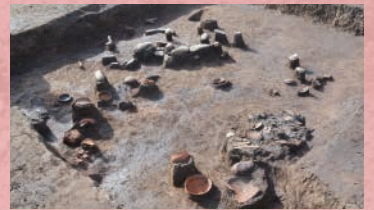
あさひ おしまこふんぐん 旭・小島古墳群